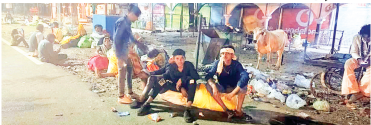
लोकसभा चुनाव में अपने मतदान से वंचित रह जाएंगे कई मतदाता