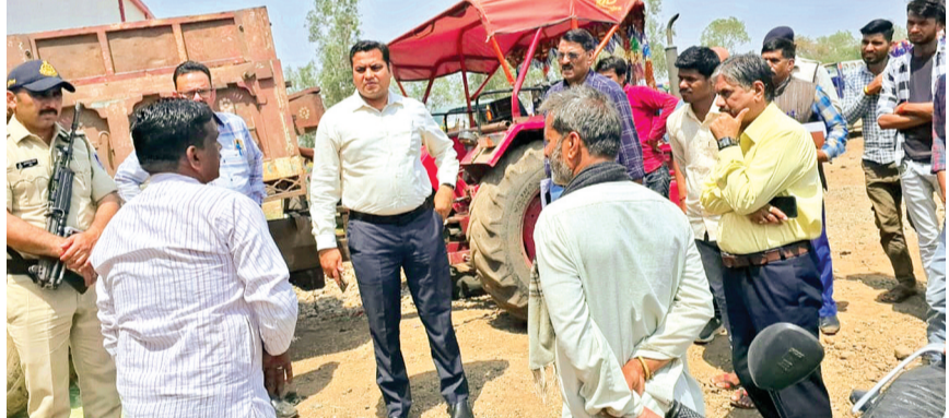
हरिभूमि न्यूज ►► नलखेड़ा